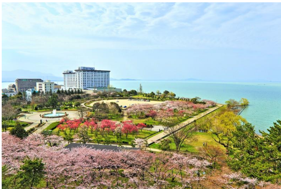
長浜ロイヤルホテル 全景

大和リゾート株式会社 広報室 浅井 〒541-0051 大阪市中央区備後町 1 丁目 5 番 2 号 大和ハウス備後町ビル 5 階 TEL：06-6229-7218 FAX:06-6229-7202 URL: http://www.daiwaresort.jp