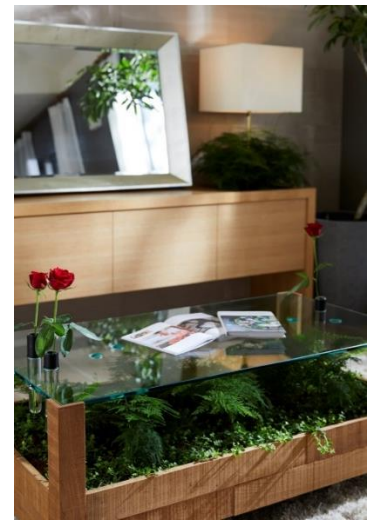
左：『グランフォーラム練馬田柄』モデルハウス 中・右：『グランフォーラム練馬富士見台』モデルハウス

パークーズがコーディネートしたモデルハウスは、「花と緑と暮らす新しいライフスタイル」を提案。グリーンを「育つインテリア」としてデザイン性と機能性を重視し、植物も人も育つ空間づくりを行っています。