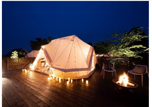
GRACE TENT (定員 3 名)

自然を身近に感じながらアウトドアステイを楽しめる広々テント&ワイドデッキ。星空の下での食事、朝日を感じる爽やかな目覚めを。