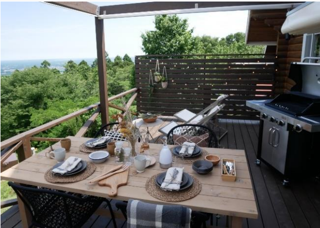
SKY CABIN (定員 4 名)

広がる空と山頂から眺める景色を、心ゆくまで楽しめるキャビン。木の温もりを感じる心地いい空間で、まるで家にいるような、くつろぎの時間を。