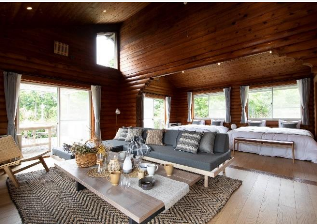
SUITE CABIN (定員 6 名)

大きな窓からやさしい光がさし込む、広々としたキャビン。ゆったりとした特別な空間で、大切な人たちと、贅沢で優雅な時間を。