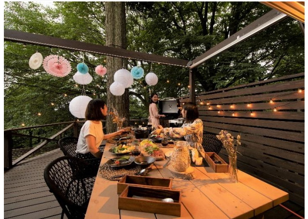
FOREST CABIN (定員 6 名)

森の緑に囲まれる、自然を一番身近に感じるキャビン。2 ベッドルームを備えた空間で、家族や仲間とゆったり「おこもりステイ」を。