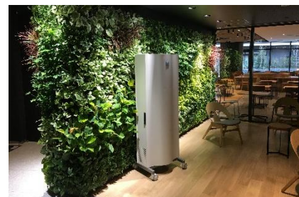
GENANO ® 5250A

※メーカーテスト結果として、ウイルス抑制(25 m 3 密閉空間において風量 40 m 3 /h で稼働し、416 分後 99%抑制) 菌抑制(25 m 3 密閉空間において風量 40 m 3 /h で稼働し、388 分後 99%抑制)の効果検証。