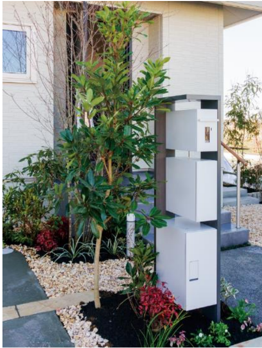
「Qual-D (クオール・ディー)