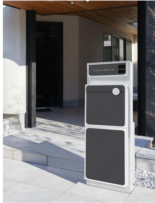
「Qual-D (クオール・ディー)