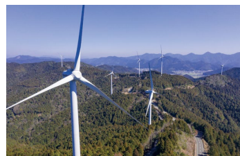
DREAM Wind 愛媛西予(愛媛県)