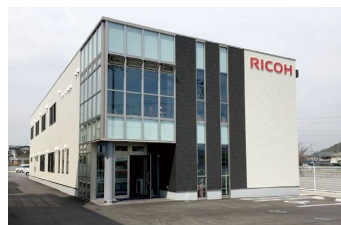
リコージャパン和歌山支社