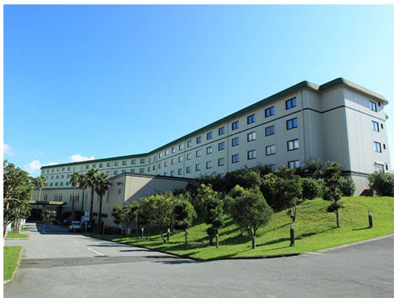
南房総富浦ロイヤルホテル 全景