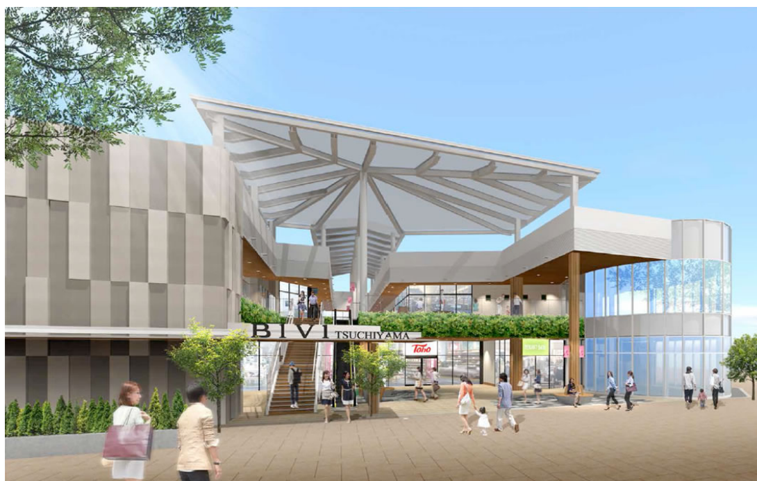
※イメージであり、実際とは異なる場合があります。

BiVi 土山は、地域の新しい交流の場として駅周辺のさらなるにぎわいづくりを目指します。