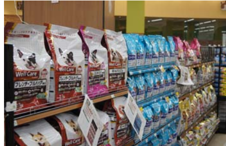
【ペットフードコーナー】