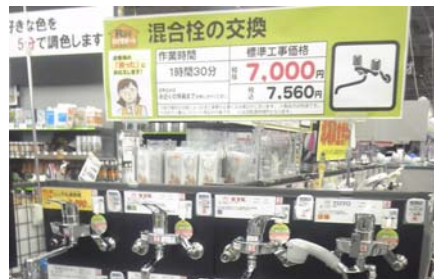
【交換代行サービス】