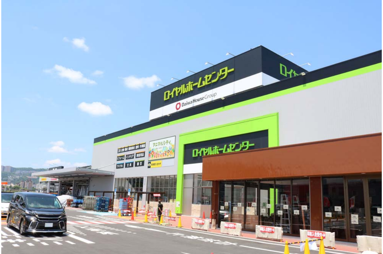
【ロイヤルホームセンター宝塚店】