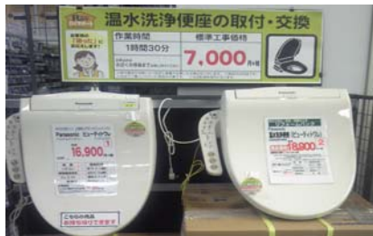
【取り付け交換代行サービス】

商品の販売だけでなく、玄関網戸の取り付け、電球・管球の交換など、取り付け・交換が困難なお客さまに代わってサービスする「ロイサポート」を行います。