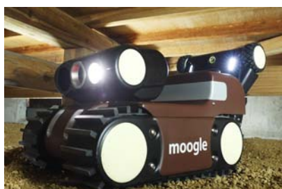
床下点検ロボット「moogle」