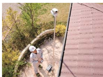
屋根点検カメラ「たかみ君」