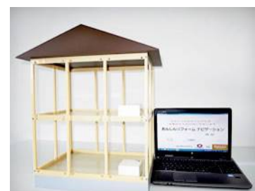
簡易耐震診断測定器 「あんしんリフォームナビゲーション」