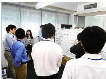
朝会・夕会での情報共有