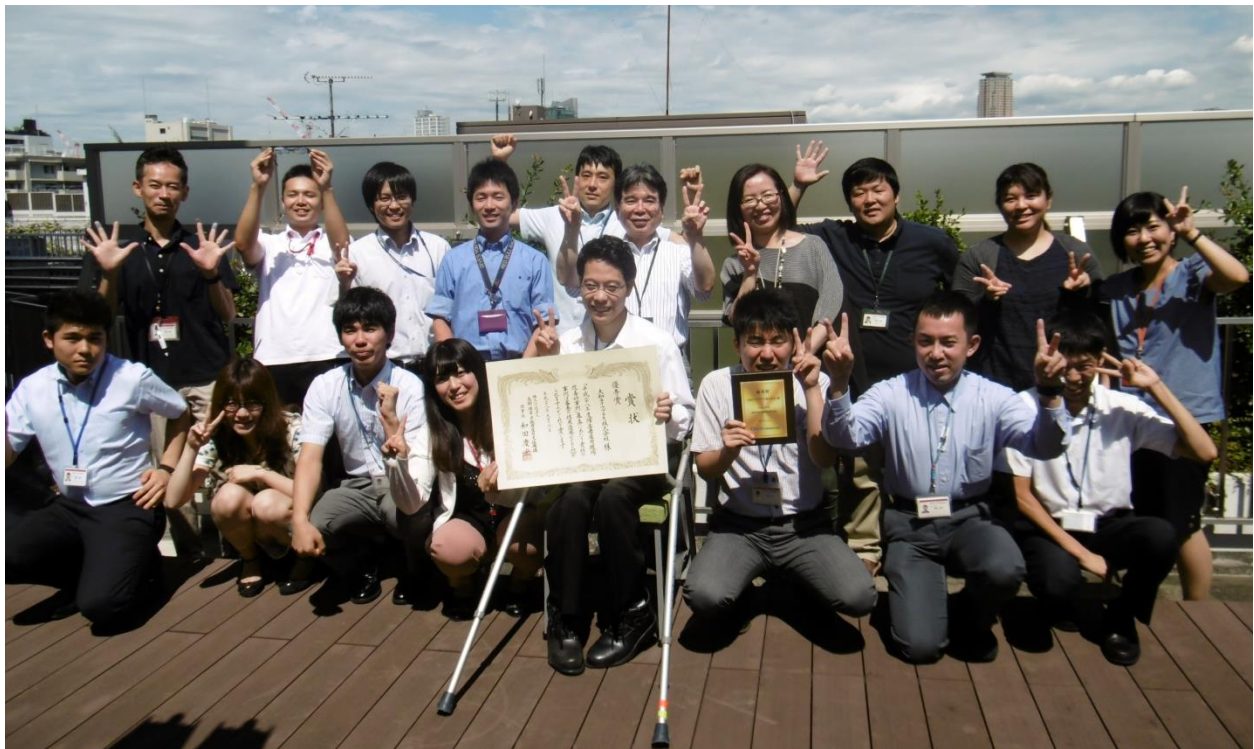
大和ライフプラスの従業員

このたびの受賞では、①障害の特性を踏まえた上で、配置転換やサポートにおいてきめ細かな対応がなされていること。②支援機関を効果的に活用しながら、採用から職場定着、さらには退職者の職場復帰まで個々人の特性に配慮した取り組みをしていること(同機構の講評より)が評価されました。