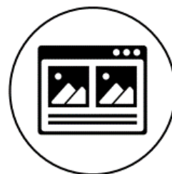
④ WEBの物件サイトに 掲載し、自宅でも閲覧 できるようにする