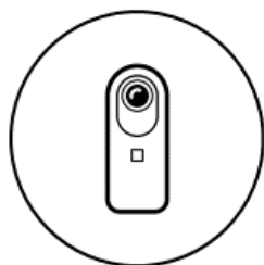
① 対象になる物件を 360度カメラで撮影

実写の室内映像と、CGのリノベーション後のイメージを360度で見ていただく仕組みです。