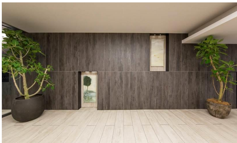
■『イニシア世田谷松陰神社前』エントランスホール写真

檜等の素材とデザインにこだわった共用エントランスには、松陰神社前にゆかりのあるアーティストの方に、当物件が誕生する前にこの土地にあった古民家と、それを見守る樹をモチーフに作成いただいたフランス画風の絵を飾りました。松陰神社前を愛するアーティストに、土地の歴史を絵に残し、新たなマンションに伝えていくことも、お客さまからご評価いただきました。