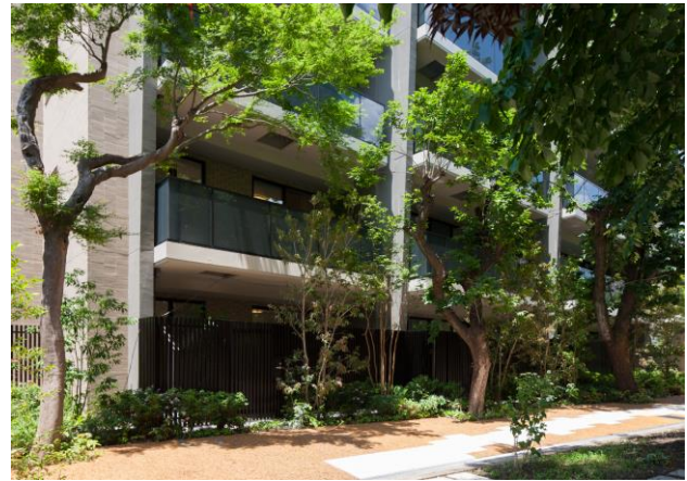
■『イニシア世田谷松陰神社前』外観・外構写真