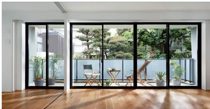
■『イニシア世田谷松陰神社前』モデルルーム写真

緑に囲まれた立地環境を活かし、サッシ高さを確保するための扁平梁や約8m※にもなる大開口の超ワイドスパン設計を採用することにより、心地よい陽光と風を取り込む、圧倒的な開放感を実現しました。また、素材本来の風合いの上品な設えとするため、フローリングには、天然木を張り込んだ幅広の突板を採用。肌に触れるやさしい温もりと自然の薫り、そして「本物」にこだわる住まいとして高いご評価をいただきました。※一部タイプを除く