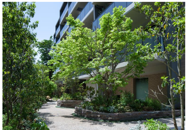
■『イニシア世田谷松陰神社前』外観・外構写真

ご契約いただいたお客さまからは、渋谷等の都心に近くでありながらも、バス通りから一本奥に入った静かな立地であること、稀に見る緑量ある空間に清々しい「緑の景観」が臨めること、また歴史を受継ぐつくりこみから、“世田谷の邸宅”として非常に高くご評価いただきました。