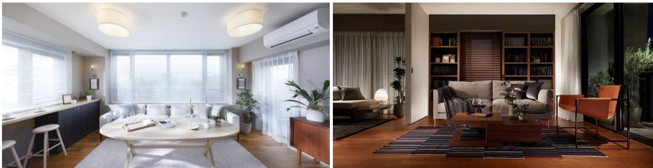
■『イニシア世田谷松陰神社前』モデルルーム写真

「モデルルームのような素敵な家ですごしたい」といったご意見をもとに生まれた、住戸内の壁やキッチンカウンターを好みのクロスやタイルでコーディネートする、「ホームデコレーションサービスプレミアム」を採用。さらに、「家だけでなく松陰神社前にも愛着を持っていただきたい」そんな思いから、地域ゆかりのアート、香り、草花をエッセンスとして追加する仕組みを採用しました。また、さまざまな世界観から理想のコーディネートを見つけていただくべく、テイストの異なる複数のモデルルームを用意、ご案内しました。