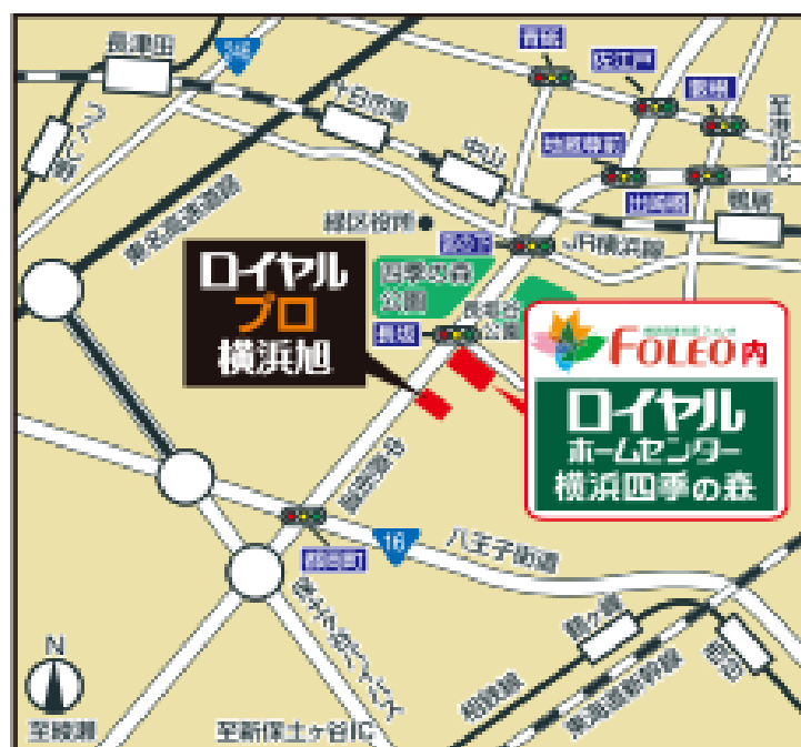
【「ロイヤルプロ横浜旭」地図】