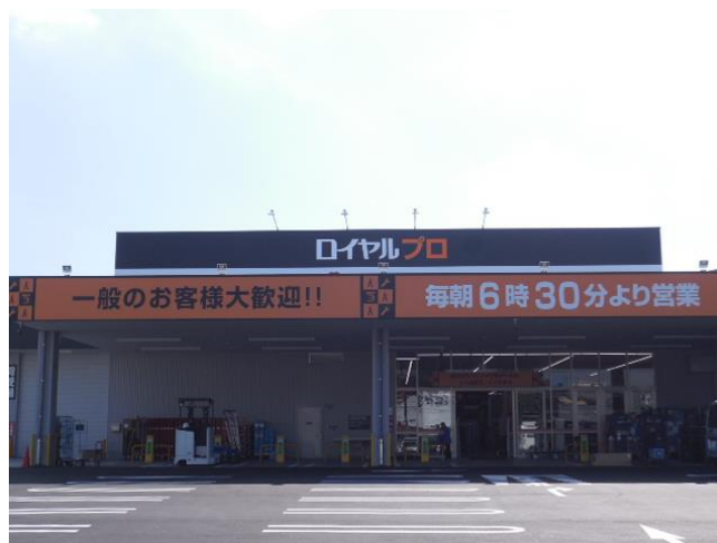
【ロイヤルプロ横浜旭】