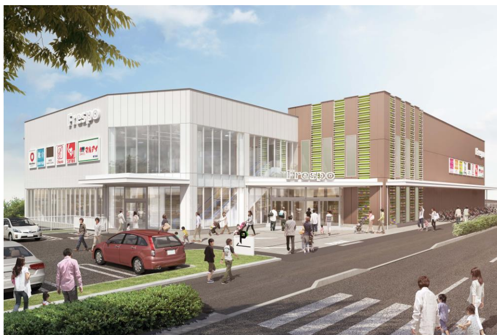
完成予想パース ※イメージであり実際とは異なる場合があります。

「フレスポ」とは《フレンドリースポット》の略称で、「日常生活に便利なショッピングセンター」をコンセプトに展開しています。当社が開発する複合商業施設としては、兵庫県内で6ヶ所目となります。（①センチュリーガーデンフレスポ、②ブランチ神戸学園都市、③玉津商業施設、④フレスポ赤穂、⑤B i V i 土山）