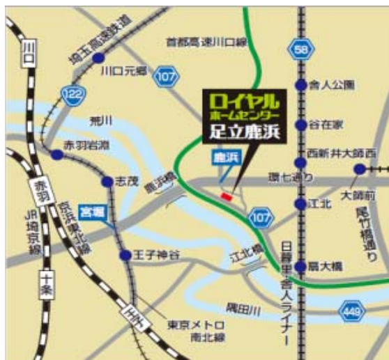
ロイヤルホームセンター足立鹿浜 (案内図)