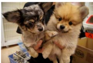
「(左) チワワ (右) ポメラニアン」