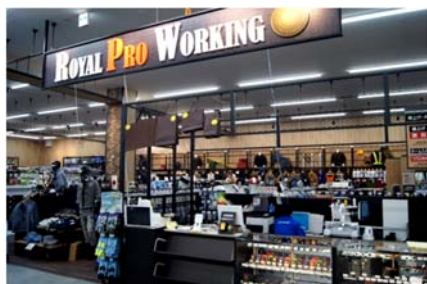
「ロイヤルプロワーキング」

※2. 会員様は名入れ1箇所無料、裾上げは無料で利用可能です。裾上げは即日お渡し可能。 (但し、数量と受け付け時間により翌日又は後日対応となる場合がございます。)