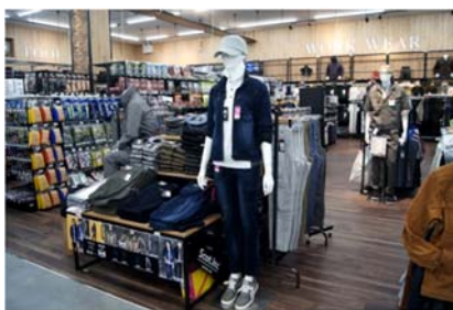
「建築現場で活躍する女性向けの作業服」