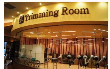
「トリミングルーム」