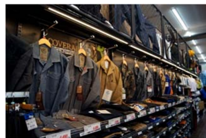
「ワークウェアコーナー」