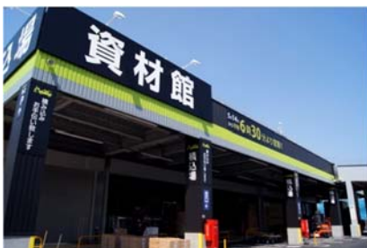
「建築資材を取りそろえた資材館」