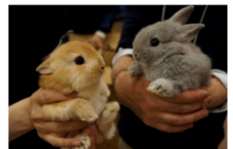
「ネザーランドドワーフ」