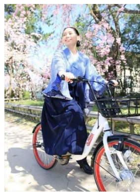
【シェアサイクル利用イメージ】