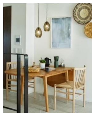
サンプルルーム写真（トランジットジェネラルオフィスによるコーディネート）