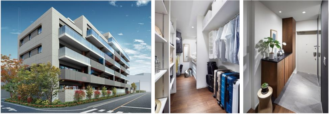
『イニシア志木レジデンス』外観完成予想図、モデルルーム・ファミリークローゼット、ウエルカムホール（玄関）