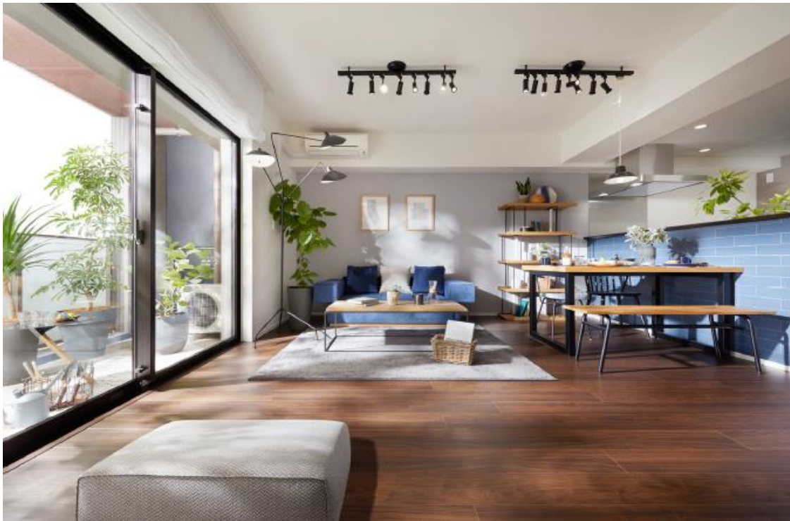
「イニシア志木レジデンス」モデルルーム

※ 5 路線とは東武東上線・東京メトロ副都心線・東京メトロ有楽町線・東急東横線・横浜高速鉄道みなとみらい線の 5 路線をさします。