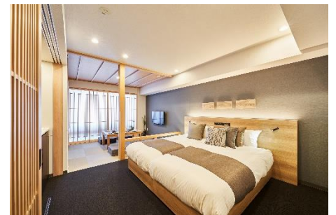
『MIMARU 京都 新町三条』客室

ホームページ： https://mimaruhotels.com/ja-jp/shinmachi-sanjo/