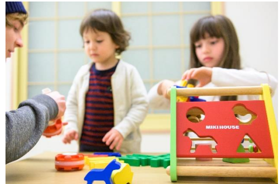
お子さまが楽しめるおもちゃ