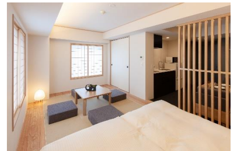
『MIMARU 東京 上野 EAST』客室

ホームページ： https://mimaruhotels.com/ja-jp/ueno-east/