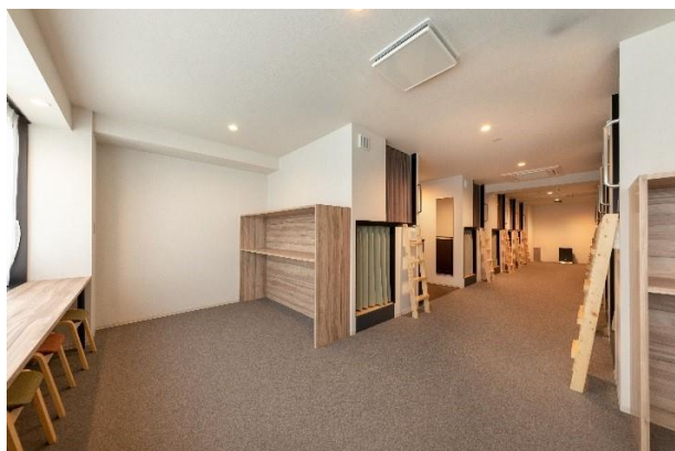
ドミトリールーム

3階から7階は客室フロアとしました。全室カードキーによるセキュリティーとし、大きな荷物やノートパソコンなどが置ける広めのドミトリールームや和室生活が体験できる5名個室など、12タイプの客室を設けました。