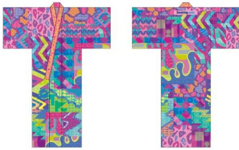
ノベルティ (オリジナル浴衣)