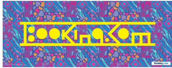
ノベルティ (オリジナルてぬぐい)