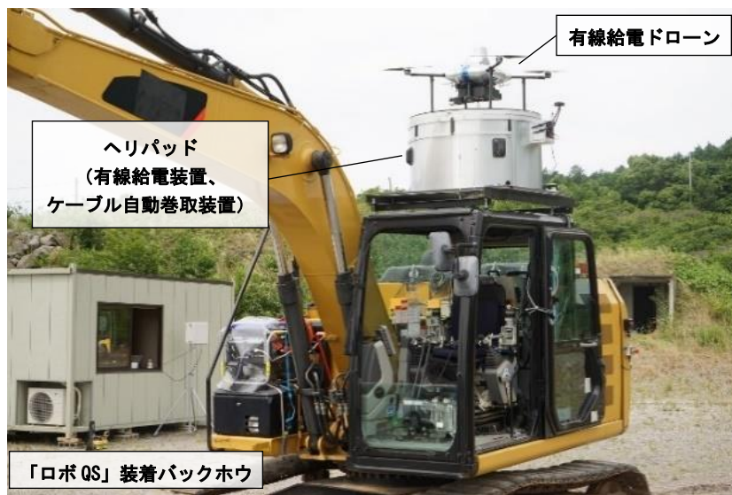
写真1 システム構成

※ 当社が国土交通省九州地方整備局九州技術事務所および株式会社 IHI と共同開発した、市販の汎用油圧ショベルを無線遠隔操縦するロボット