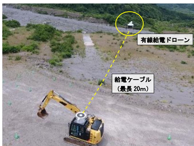
写真 2 (左) 自動追従飛行の状況

今後、無人化施工現場への導入や他の建設機械への応用、災害が発生した地域での活用など幅広く利用できるよう実証試験を進め、実工事への本格導入を目指します。