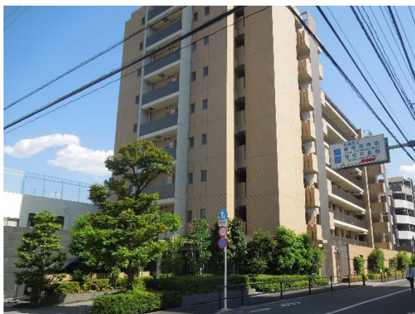
『イニシア蓮根氷川の杜』外観

※修景：都市計画・道路計画などで、自然の美しさを損なわないように風景を整備すること