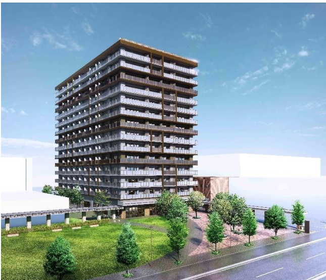
『札幌北 4 東 6 周辺地区再開発プロジェクト』 完成予想図