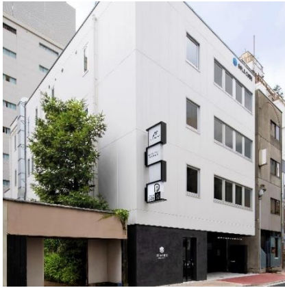
「SOLA CUBE 横濱関内」外観