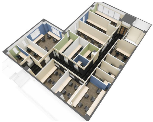
3階フロアプラン完成予想 CG