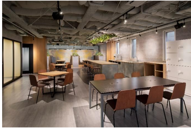
「MID POINT 横濱関内」4階ラウンジ