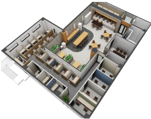
4階フロアプラン完成予想 CG