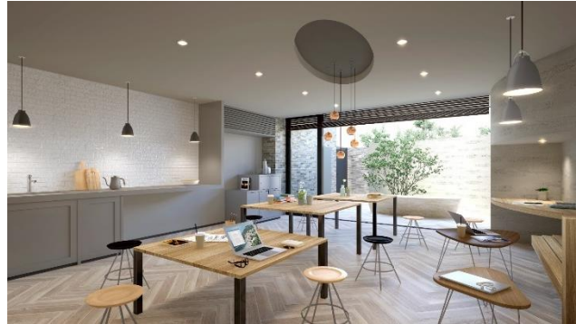
『イニシア青砥レジデンス』 共用ラウンジ完成予想 CG