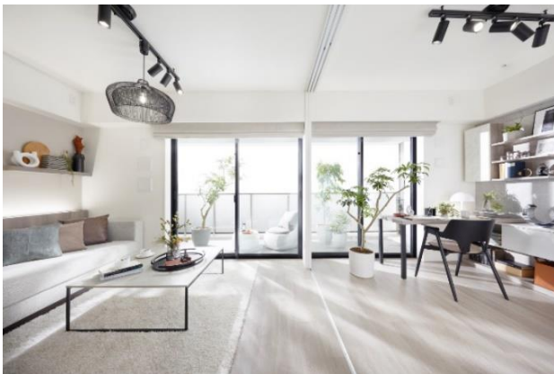
『イニシア青砥レジデンス』 モデルルーム写真

三方を道路に囲まれた敷地を活かし、角住戸率を高めた全戸南西向きに開放的な採光・通風に優れたプランニングを設計しました。64㎡台の2LDKと3LDK、81㎡台の4LDKのプランには、間仕切りを自在に変えられるフレキシブルリビング、玄関の広さにゆとりをもたせたウェルカムホーム、効率的にたっぷりしまえる彩り収納など、毎日の暮らしをもっと楽しく快適にする「コスモスイニシア」オリジナルの多彩なアイデアが詰まっています。