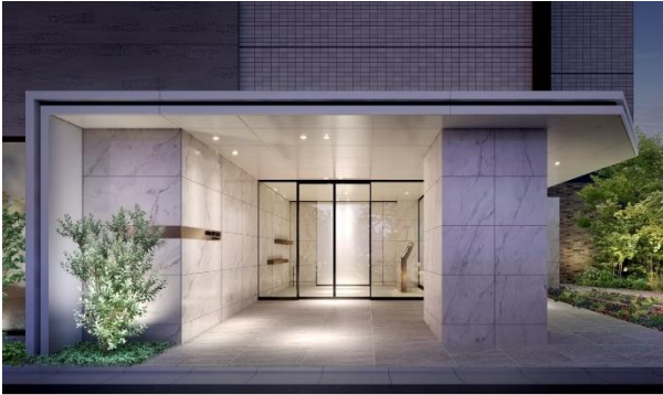
『イニシア青砥レジデンス』 エントランス完成予想 CG

青砥駅徒歩2分の街の中心に建つ住まいとして、「フラッグシップ」をテーマに街の象徴となるような建物デザインにこだわり、エントランスはキャノピー（天蓋型のひさし）で門構えを造り、より上質な空間となるようにデザインしました。共用空間においては、1st プレイスの住まいでも、2nd プレイスのオフィスでも、3rd プレイスのカフェでもない、“2.5 プレイス”として提案する共用ラウンジをご用意。ホームパーティーや、もうひとつのオフィスとしてリモートワークなど、効率的な暮らしを実現できる場所として、白とグレーを基調に木質の素材で温かみのある落ち着いたインテリアで居心地のよさを重視しました。