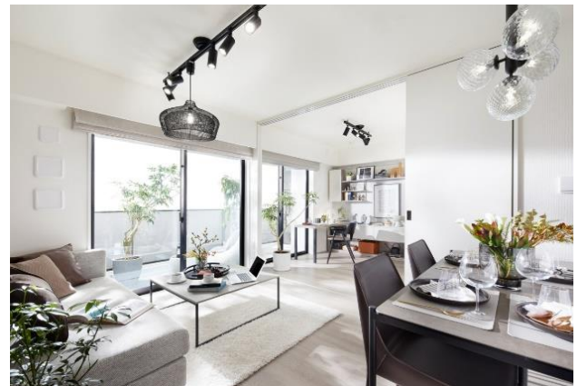
『イニシア青砥レジデンス』モデルルーム写真

また、周辺には90店舗以上が立ち並ぶ6つの賑やかな商店街など生活利便施設が充実し、日暮里駅へ1駅9分、日本橋駅へ直通15分の都心アクセスに加え、近くには青戸平和公園など、日々の暮らしにゆとりが生まれるファミリーに嬉しい生活環境が整っています。