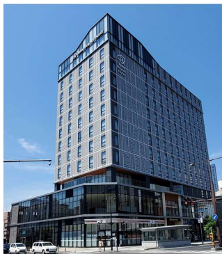
【「ダイワロイネットホテル山形駅前」外観】