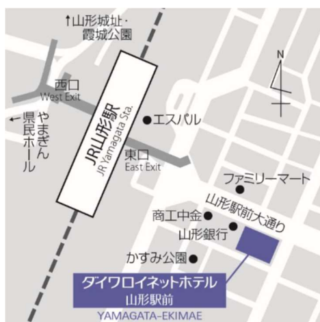
【「ダイワロイネットホテル山形駅前」地図】