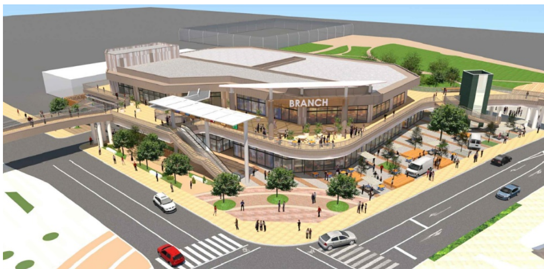
「ブランチ茅ヶ崎3」完成予想パース※イメージであり実際とは異なる場合があります。

※「インクルーシブ遊具」とは体に障害がある子ども、ない子どもと一緒に遊べる遊具です。