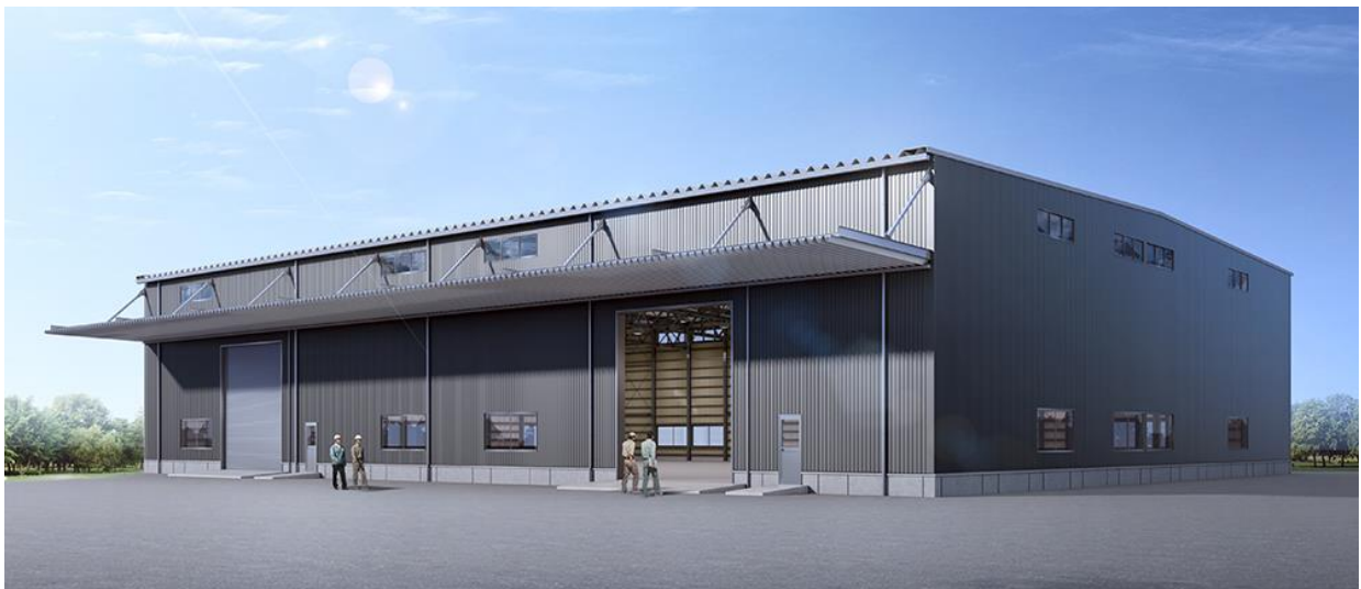
完成予想外観パース(標準プラン) ※イメージであり、実際とは異なる場合があります。

在来工法に比べ柱をスリム化することで、スペースを最大限に活かした計画が可能です。