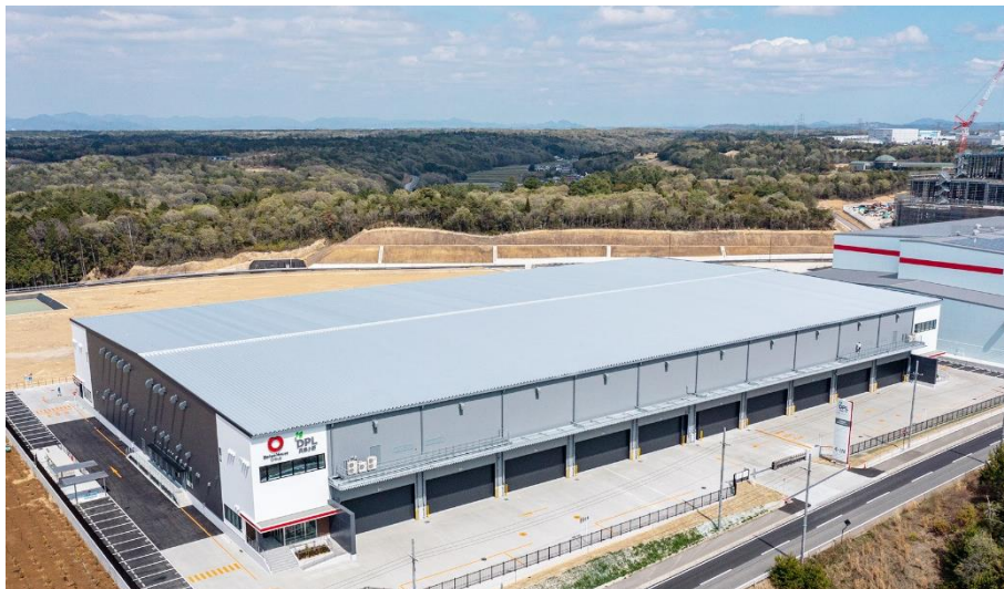
【兵庫小野物流センター】