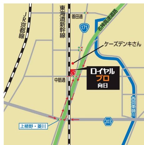
「ロイヤルプロ向日」(案内図)