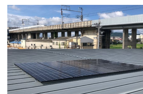
「太陽光発電システム」

当店では「人と地球にやさしい」共創共栄を目指した店舗づくりとして、2022 年内に店舗の屋根面に導入する太陽光発電システム（発電容量 48 kW、年間発電量 49,992kWh）で発電した電気を自家消費することで、年間約 18.1t の CO 2 排出量削減を見込んでいます。