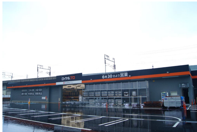
【 ロイヤルプロ向日 】

なお、当店のオープンにより、当社が運営するホームセンターは全国で59店舗目、京都府下で4店舗目となります。