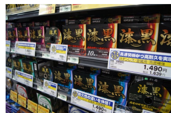
当社オリジナルブランド「漆黒」