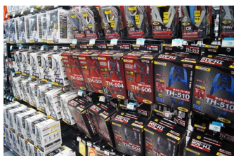
ハーネスなどの「安全用品」