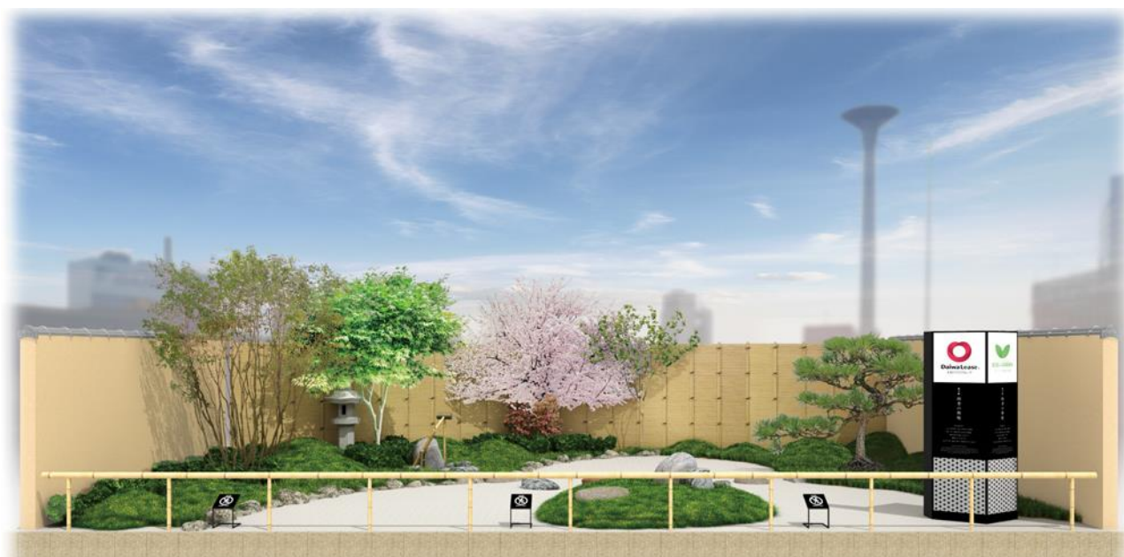
完成予想パース ※イメージであり実際とは異なる場合があります。

リニューアルする施設では、国内・海外から来阪される方々に都市の中で潤いを感じていただける待ち合わせのツーリストスポットを目指しています。