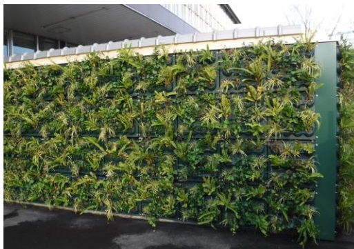
施設外周壁面に設置の「D's グリーンパレット」

D's グリーンパレットは 2018 年 4 月に発売開始した商品で、当社従来商品より薄型の壁面緑化システムとなります。湿潤時 30kg/m 2 と軽量なため、建物への負担を減らすことが可能。植物を事前養生するため、施工直後でも緑豊かな壁面を演出できます。