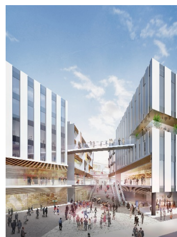
交通広場より (イメージ)